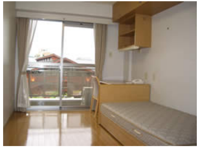
単身居室: Single room