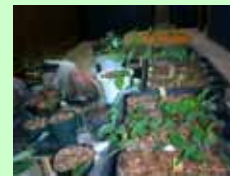
アラカシ、モミジ等が発芽成長中(施設管理部長室にて)

種子から幼苗の自己栽培の取り組み 平成18年度秋から冬にかけて約1万数千粒の種子を育成中