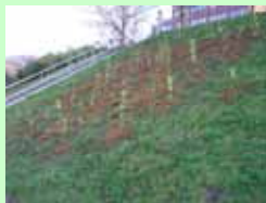
植樹位置： 番〔事務局北（本部倉庫上部）〕

幼苗密植法による試験植樹 平成18年11月31日から12月15日まで計10回 13箇所 合計約1000本