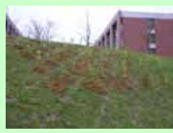
植樹位置： 番〔理学部講義棟西〕

種子から幼苗の自己栽培の取り組み 平成18年度秋から冬にかけて約1万数千粒の種子を育成中