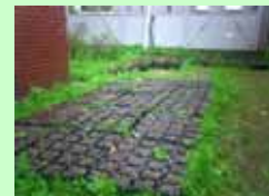
アラカシ、シラカシ等のどんぐりの育成状況(事務局1階横)